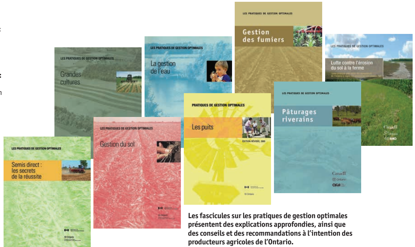
Les fascicules sur les pratiques de gestion optimales présentent des explications approfondies, ainsi que des conseils et des recommandations à l'intention des producteurs agricoles de l'Ontario.