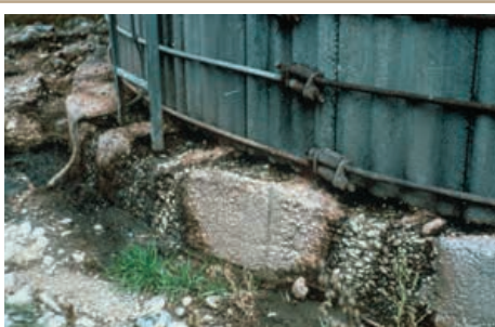
L'utilisation de matériaux appropriés et l'entretien du plancher du silo, des murs et des fondations peuvent minimiser l'écoulement des effluents. Il est également important que la structure des murs et des fondations soit solide pour la sécurité des travailleurs.

Voir la fiche technique suivante du MAAARO :