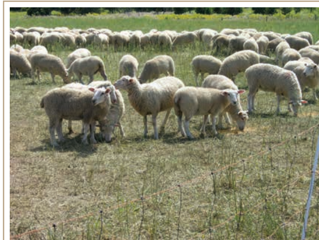
L'alimentation du bétail mise au point dans le cadre de groupes de gestion peut améliorer l'indice de consommation.