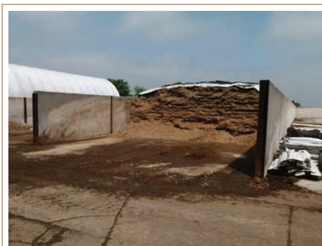
Un toit ou un couvercle réduit les pertes d'éléments nutritifs par les effluents.