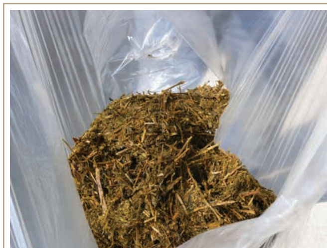
L'analyse des aliments du bétail réalisée au moins une fois par mois fournit l'information indispensable à un équilibre adéquat de la ration.