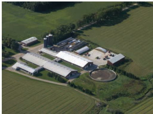
Maximiser la distance entre le silo et les sources d'eau de surface afin de réduire au minimum les risques pour la qualité de l'eau de surface.

Pour un aperçu du processus de circulation de l'eau dans une exploitation agricole et en aval de cette dernière ainsi que de l'information sur les risques à la ferme en matière de qualité de l'eau et les méthodes pratiques pour protéger l'eau, voir le fascicule PGO sur le sujet.