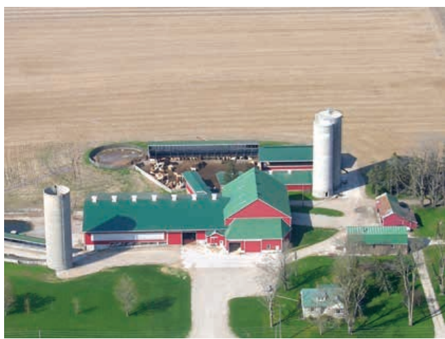
La réfection du revêtement des murs du silo contribue à empêcher l'écoulement des effluents et à maintenir le bon état de la structure du silo.