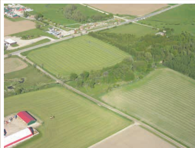
Le moment de la récolte et les précipitations sont d'importants facteurs qui influent sur la qualité de l'ensilage.