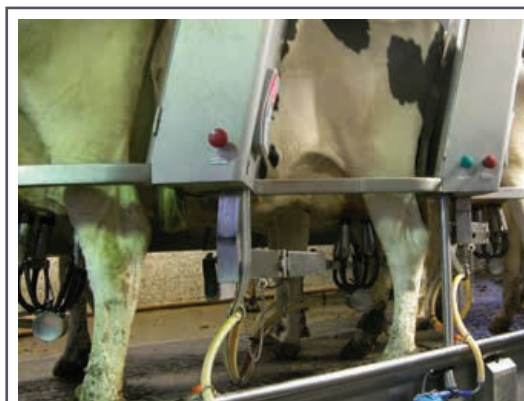
Dans les fermes laitières, le centre de traite est l'un des plus gros consommateurs d'énergie.