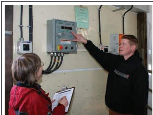
Le calcul de la consommation réelle d'énergie représente la première étape dans l'amélioration de l'utilisation d'énergie dans l'exploitation.