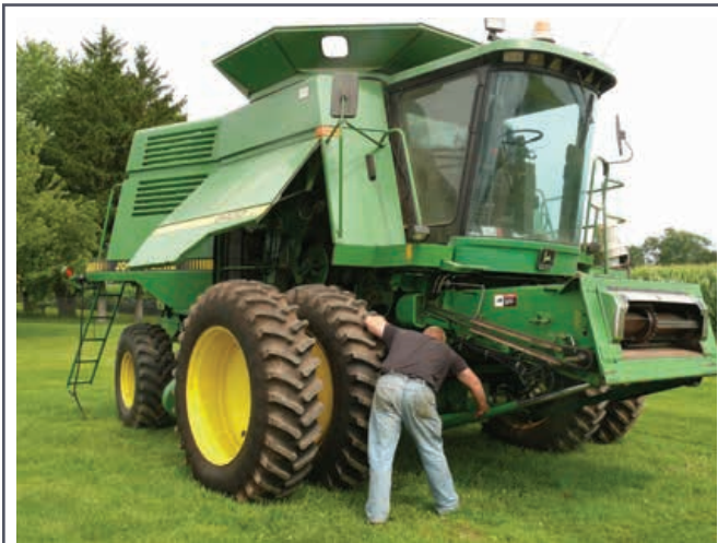
L'entretien préventif permet d'éviter des pannes coûteuses.

Pour des programmes d'entretien particuliers, consulter les manuels d'utilisation et communiquer avec le concessionnaire de la machinerie.