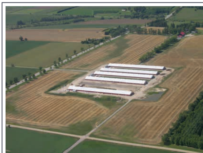
Une construction de qualité réduira les coûts énergétiques tout en maximisant la vie utile des bâtiments agricoles.