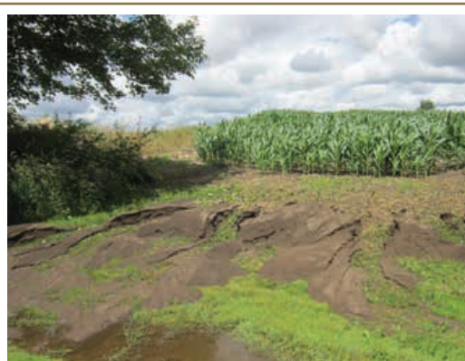
Le sol qui atteint les eaux de surface nuit à leur qualité parce qu'il y ajoute des sédiments et des éléments nutritifs.