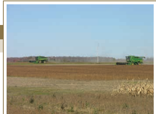
Bien que cela ne soit pas toujours possible, on réduit beaucoup le compactage lorsqu'on récolte alors que le sol est relativement sec.