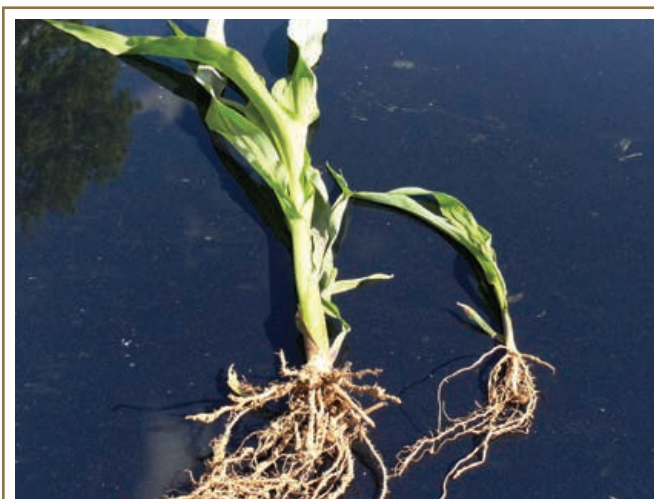
À gauche, la croissance vigoureuse des racines de la plantule de maïs est le signe d'un sol pourvu d'une bonne structure. La plantule de droite poussait dans un sol compacté dont la structure était mauvaise.