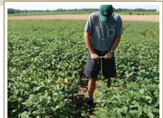
Une analyse peut révéler des informations précieuses sur la santé d'un sol, y compris sur sa teneur en matière organique.