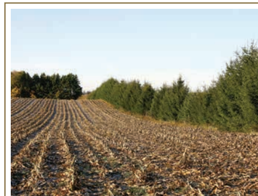
Les brise-vent ralentissent le déplacement d'air et l'empêchent de déplacer les sols.