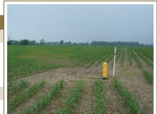
L'installation d'entrées de drain à la surface et l'aménagement d'un drainage souterrain amélioreront le drainage superficiel et réduiront le déplacement de l'eau à la surface du sol, diminuant ainsi le risque d'érosion du sol.