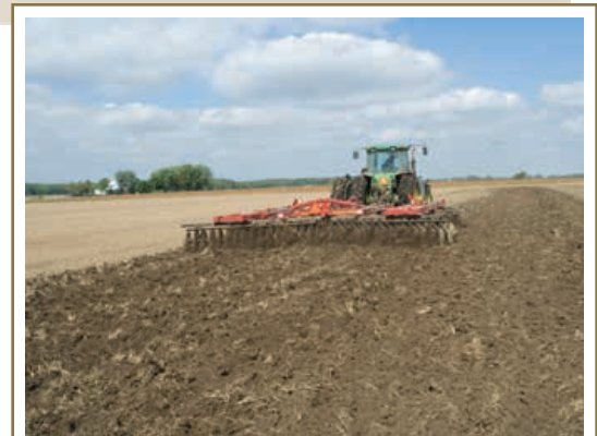
Régler les instruments de travail du sol et les surveiller pendant l'utilisation pour éviter qu'ils attaquent le sous-sol.

Pour plus d'information sur les mesures de prévention de l'érosion par le travail du sol, voir les pages 46 à 47.