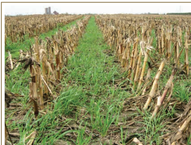
Les cultures de couverture réduisent l'érosion en nappe parce qu'elles ralentissent le mouvement de l'eau et ajoutent de la matière organique au sol.