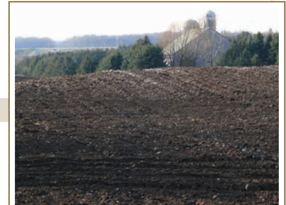
Lorsque les instruments de travail du sol ameublissent celui-ci sur un terrain accidenté ou ondulé, ils provoquent une érosion. Les principales causes d'érosion sont les outils qui déplacent beaucoup de sol, la gravité et la vitesse des véhicules.

En plus des sources d'information du MAAARO indiquées à la page 2, voir également les fascicules suivants de la série « Les pratiques de gestion optimales » (PGO) :