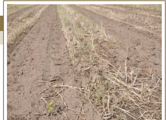
Les bandes de protection constituent une solution adaptable pour les terres sensibles à l'érosion par le vent. On peut s'en servir conjointement avec les brise-vent ou comme mesure temporaire en attendant que les arbres soient assez gros pour offrir une protection suffisante.