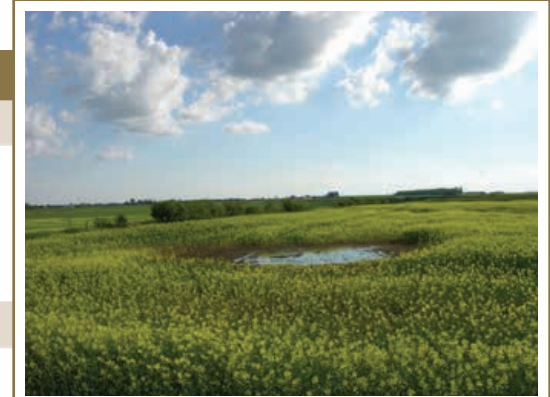
La trop forte teneur en humidité du sol peut nuire à la croissance des cultures et à l'enchaînement des opérations au champ, et elle peut accroître les risques de compactage.