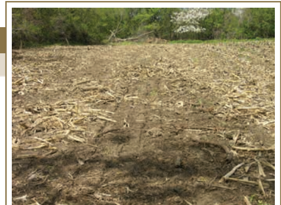
Les systèmes de semis avec travail réduit sont moins coûteux et contribuent au maintien de la matière organique dans le sol.