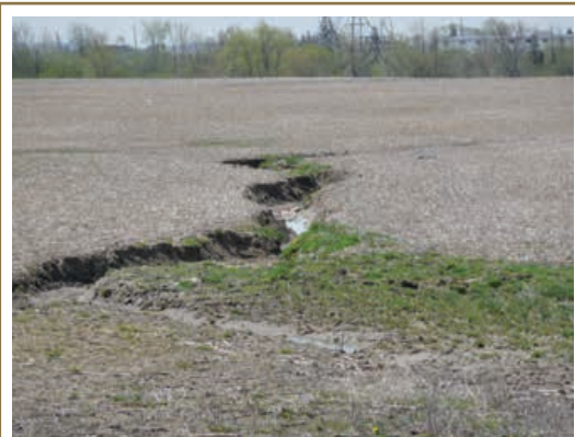
L'érosion en rigoles peut créer des dépressions assez profondes pour endommager les appareils aratoires.