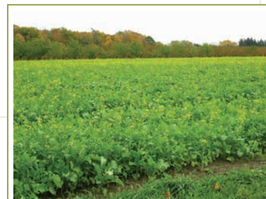
Les cultures de couverture permettent de réduire les risques de perte d'éléments nutritifs d'un champ.