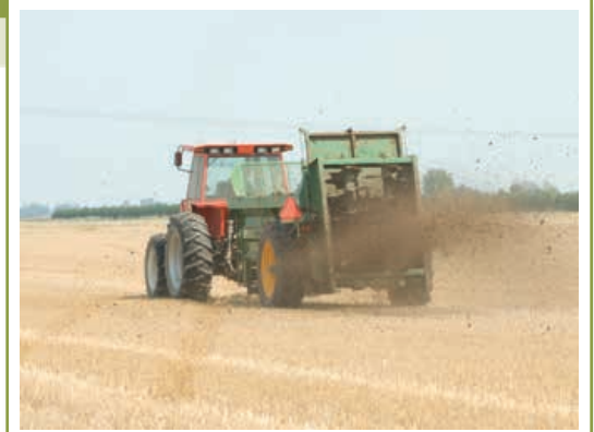
Les épandages de fumier ou de biosolides peuvent apporter de grandes quantités d'éléments nutritifs aux cultures, ils améliorent la structure des sols et permettent de réduire le coût des engrais ajoutés.