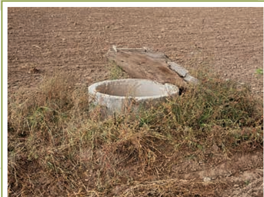
Connaître l'emplacement des puits voisins des champs cultivés et respecter les distances de retrait pour les épandages.