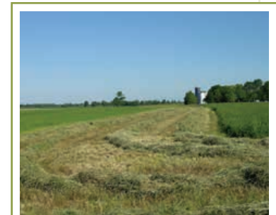
Un peuplement dense de légumineuses peut fournir 45 kg/ha d'azote à la culture suivante.

Pour trouver d'autres conseils sur « le bon dosage », voir les pages 80 à 84 de Gestion des éléments nutritifs destinés aux cultures, un fascicule PGO.