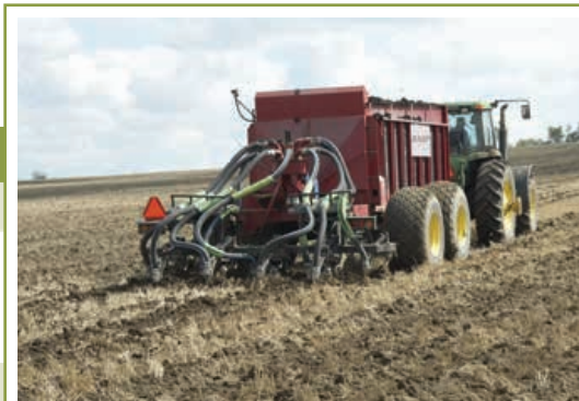
Pour toute injection d'engrais dans le sol, respecter une distance de retrait d'au moins 3 m (10 pieds) à partir de tout point d'eau de surface.