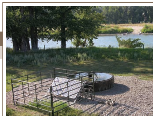
Fournir de l'eau propre au bétail à une bonne distance du ruisseau et de la zone inondable.