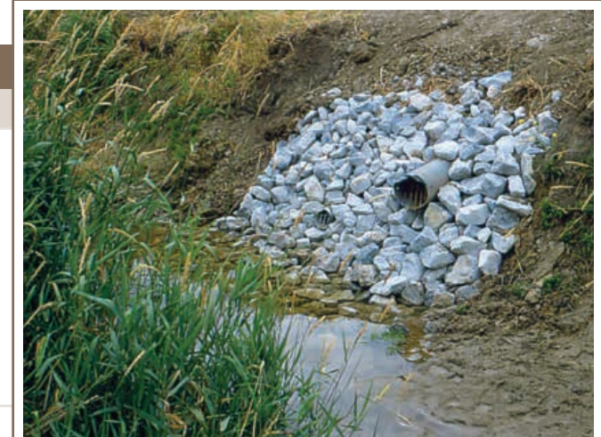
Des sorties de drainage bien placées et bien conçues permettent de prévenir l'érosion des berges et de maintenir la stabilité des bouches de drain.

Des lois fédérales, provinciales et municipales sont en vigueur afin d'assurer que toute personne qui effectue des ouvrages dans les cours d'eau ou aux environs de ceux-ci tient compte de tous les utilisateurs de ces cours d'eau, y compris les propriétaires fonciers et le public, et respecte également la vie aquatique. Pour plus d'information sur les aspects juridiques du drainage des terres cultivées, voir la page 60 du fascicule BMP25F intitulé Drainage des terres cultivées.