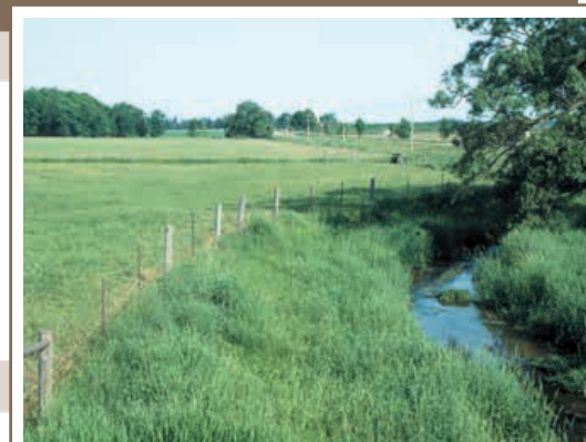
La pose de clôtures de manière à isoler une bande étroite le long des berges permet de protéger ces dernières et d'aménager à l'extérieur de cette bande des pâturages pour toute la saison ou des pâturages intensifs.