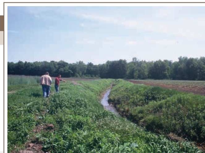
Les propriétaires fonciers devraient connaître l'emplacement des bouches de drain sur leur terrain, afin d'en faciliter la surveillance et l'entretien.