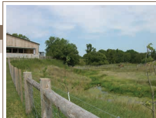
Les zones riveraines saines agissent à titre de filtres vivants, en captant les sédiments et les autres matières qui proviennent des activités effectuées en amont.