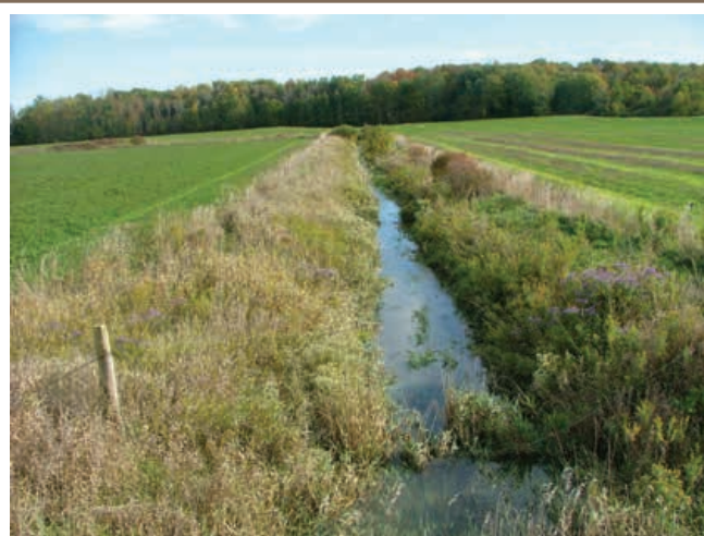
La présence d'un épais couvert végétal stabilise les berges et réduit beaucoup les besoins d'entretien.